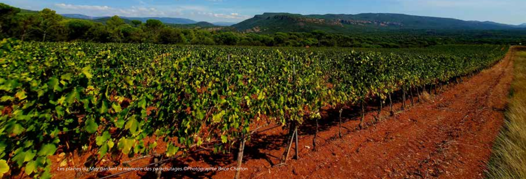
Les plaines du Muisy gardent la mémoire des parachutages.